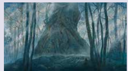
「不死鳥」(部分) 2022年～ 個人蔵

茨城県天心記念五浦美術館 TENSHIN MEMORIAL MUSEUM OF ART, IBARAKI 〒319-1703 茨城県北茨城市大津町椿2083 Tel. 0293-46-5311